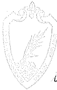
Pere Prats i Lladó Gerent

Sant Esteve Sesrovires, 5 de maig de 2016